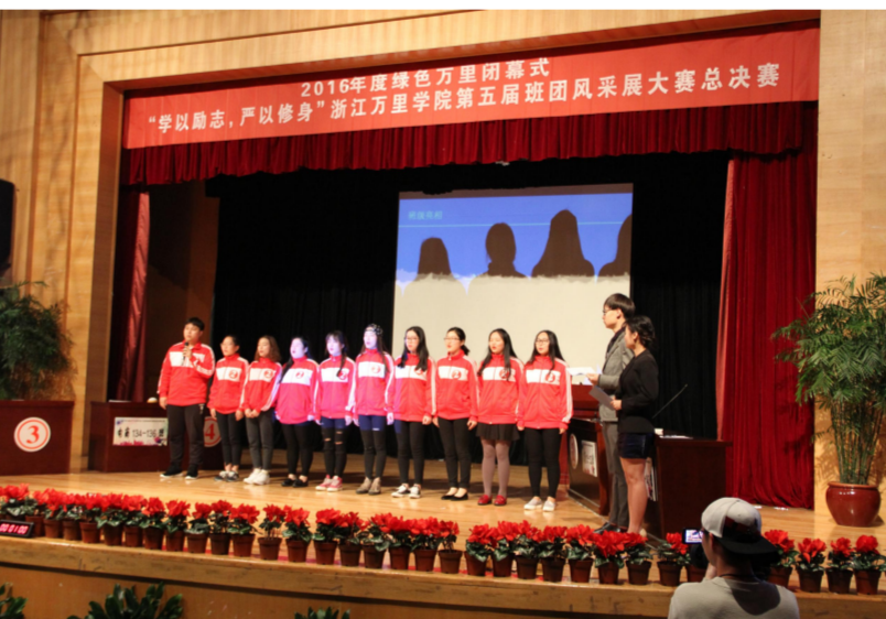
编辑室地址:浙江万里学院钱湖校区62号楼521室

为引导广大青年学子践行社会主义核心价值观,增强班级荣誉感与归属感,全面推进文明修身教育,给第二课堂注入丰富的文化活动,校团委、现代物流学院联合开展2016年度绿色万里班团风采大赛暨第五届“学以励志,严以修身”班团风采大赛。