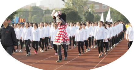
现代物流学院师生在校第十六届运动会上的精彩瞬间